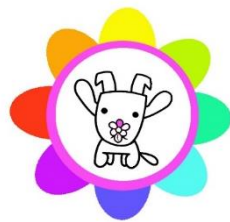
マスコットキャラクター 「はなやぎくん」